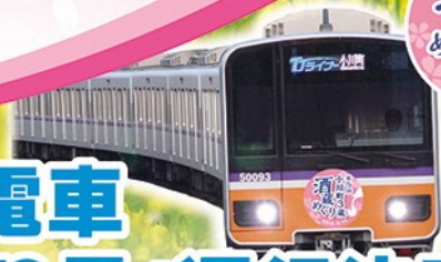
ヘッドマーク掲出列車 (イメージ)

種別:快速急行(クロスシート運転) ・どなた様でもご乗車できます(別途、運賃は各自負担) 【各駅情報】和光市駅9時27分 志木駅9時32分 川越駅9時47分 坂戸駅9時58分発